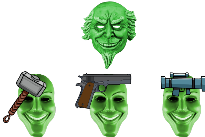
Figura 3: Representació d'un constructor i de tres guerrers amb martell, pistola i bazuca, respectivament.